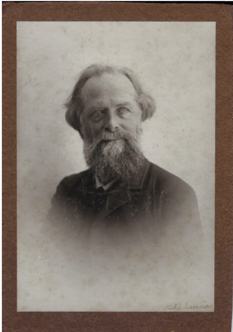
Fig. 2 Élisée Reclus