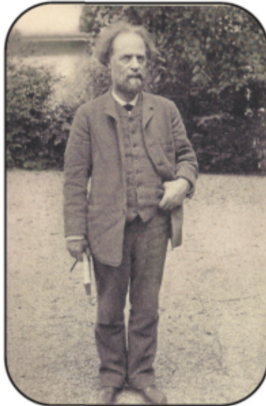
Fig. 3 Photo d'Élisée Reclus prise par son neveu Paul Reclus 🐾

implications politiques de sa vision dans le contexte de la pensée socialiste et anarchiste d'alors ?